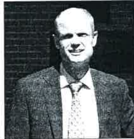
Stef Blok is een vertrouweling van Rutte.

Blok zit sinds 1998 in de Tweede Kamer en staat bekend als een onverstaanbaar Kamerlid. Hij was in 2003/2004 voorzitter van de Kamercommissie die onderzoek deed naar het integratiebeleid. Ondanks politieke druk om te concluderen dat het één grote mislukking was, kwam Blok met een genuanceerd eindrapport. Daarmee trotseerde hij de hoon van veel partijen waar