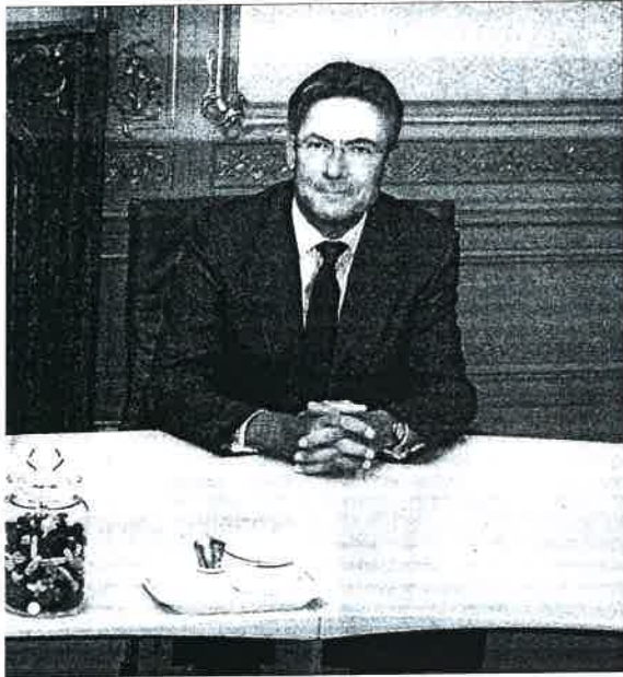
Aan de onderhandelingstafel ontstond tussen Wilders, Rutte en Verhagen een hechte band.

aal gebied gewoon links is. Dat heeft hij sterk uitonderhandeld. Bovendien bevindt Wilders zich in een luxe positie. Hij kan straks meelifen op het succes en afstand nemen als het misgaat."