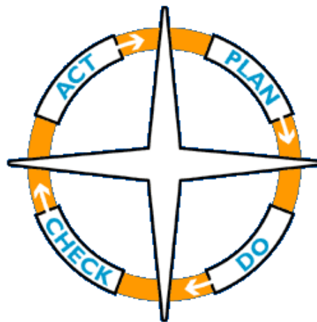
Figuur 1: De kwaliteitscirkel met de plan-do-check-act fasen

Veel van de op de markt verkrijgbare standaard IT-oplossingen zijn in staat om missie, visie, strategie (met oorzaak-en-gevolgdiagrammen), doelstellingen, kritische succesfactoren en prestatie-indicatoren fraai te presenteren. Er is ruimte voor het toevoegen van commentaar om de verschillen tussen actuele prestaties en budget te verklaren. Dit type systemen valt onder prestatie metings systemen. Voor het implementeren van de strategie is prestatie meting belangrijk maar onvoldoende, een wezenlijke component ontbreekt. Om de strategie effectief te kunnen realiseren zal de organisatie haar strategische initiatieven (ofwel acties) goed moeten uitvoeren. De doelstellingen van de onderneming wordt immers niet gerealiseerd door alleen maar meten maar door de juiste acties uit te voeren, zoals bijvoorbeeld het lanceren van nieuwe producten en diensten en het optimaliseren van de waardeketen. Indien deze actiecomponent ook wordt afgedekt in de IT-oplossing is er sprake van een prestatie management systeem. Het totale prestatie management proces wordt dan ondersteund. Het prestatie management proces bestaat uit een aantal deelprocessen. Deze deelprocessen vormen samen een kwaliteitscirkel. Deze kwaliteitscirkel (figuur 1) ligt ten grondslag aan elk kwaliteitsverbeteringsprogramma.